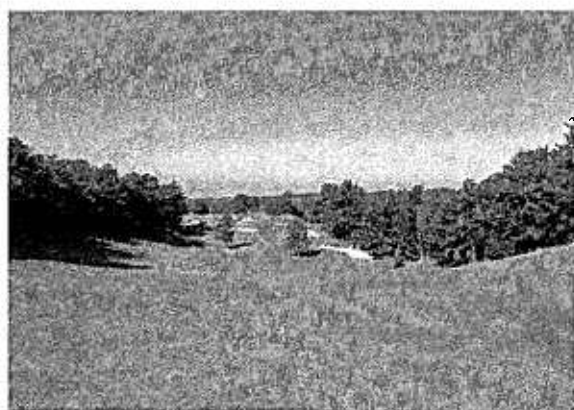
岡崎カントリー倶楽部 1 番ホール

1965 年開場、コースは小菅隆三氏、中谷富美男氏による設計で、かつては海の底であったという「ごぼん山」の尾根を生かしてレイアウトされた標高約 170m の丘陵コースです。豊かな自然の中で、岡崎市街地の景観を楽しみながらプレーできるようデザインされております。フェアウェイも広く好スコアも期待できることから、女性やシニアの方にも幅広くプレーをお楽しみいただけます。