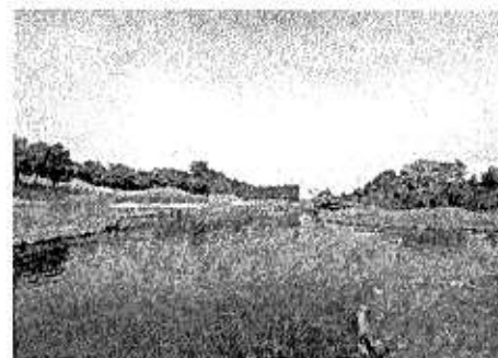
岡崎カントリー倶楽部 14 番ホール